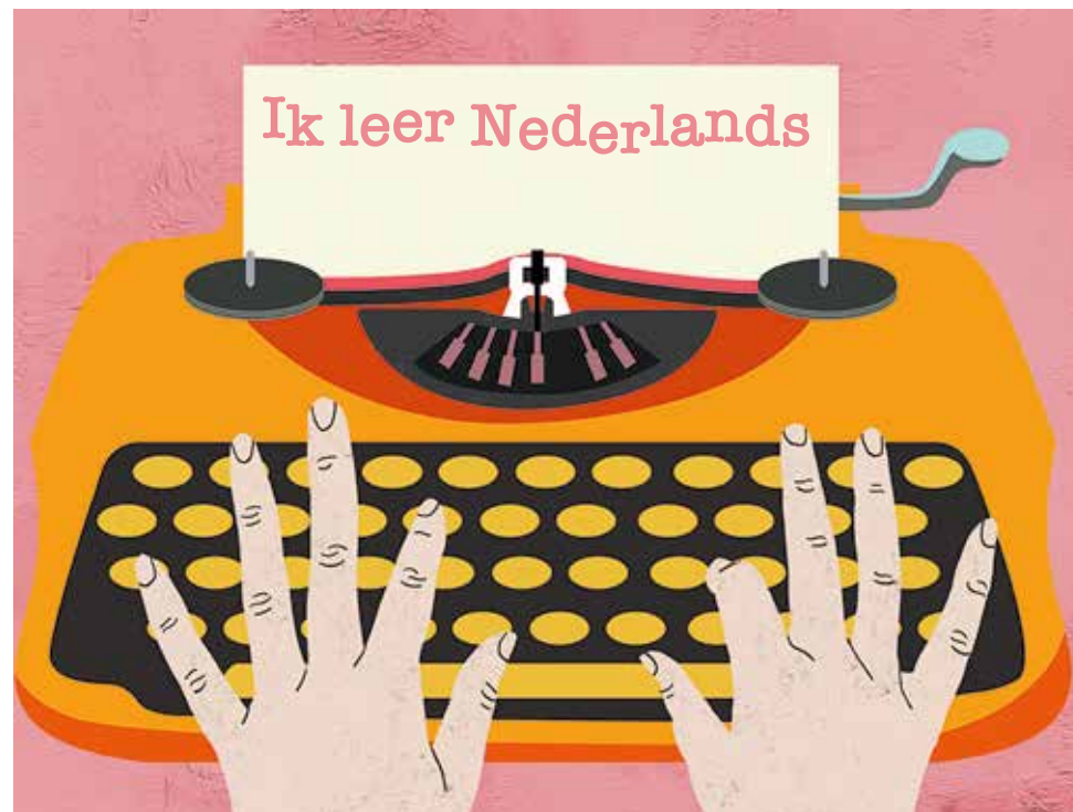
Illustratie: Simone Golob