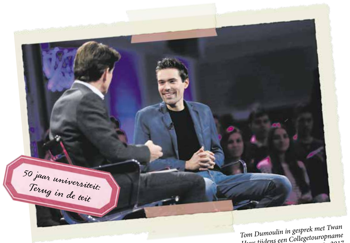
Tom Dumoulin in gesprek met Twan Huys tijdens een Collegetourname bij UM Sport in 2017